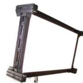
Celeb 200 DMX