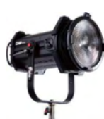
Q8 LED トラベルキット