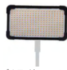
フレキシブルライト FL-B25