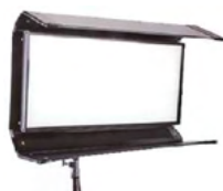
Diva-Lite LED 20DMX