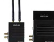
BOLT 500 XT