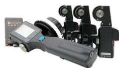
compact set 3