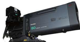
UA80×9 1.2× EXT