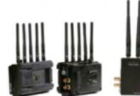
BOLT 3000 XT