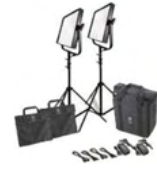
1×1 Bi-Color 2灯セット