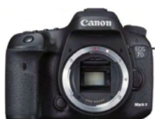
EOS 7D Mark II