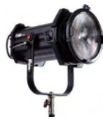
Q8 LED トラベルキット