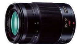
LUMIX G X VARIO 35-100mm / F2.8 II / POWER O.I.S.