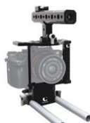
α 7R III / α 9 用リグ