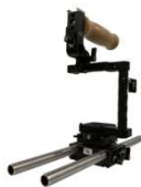
α 7 用リグ