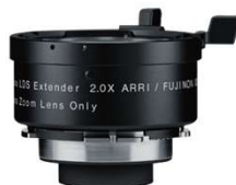
Alura 用エクステンダー ×2.0