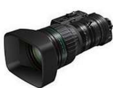
CJ45e×9.7B IASE-V H