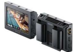
Video Assist 4K