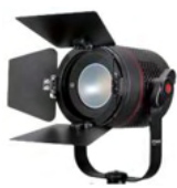
P360 Pro Plus