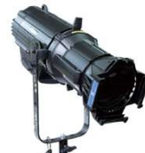
SourceFour LED Lustr +