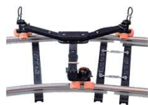
ユニバーサル・ローリングスパイダー