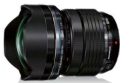
M.ZUIKO DIGITAL ED 7-14mm F2.8 PRO