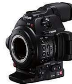
EOS C100 Mark II