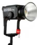
LS 600x Pro(Bi-color LED)