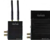
BOLT 500 XT