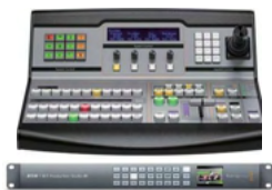
ATEM 1M/E Production 4K