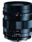
NOKTON 25mm F0.95 Type II