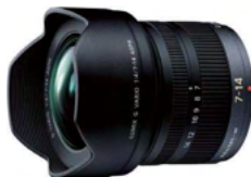
LUMIX G VARIO 7-14mm / F4.0 ASPH.