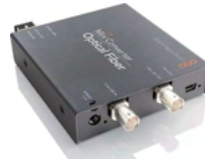
Mini Converter Optical Fiber