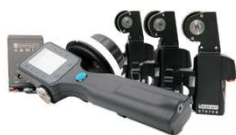
compact set 3