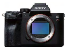
α 7R IV