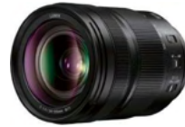
LUMIX S 24-105mm F4 MACRO O.I.S.