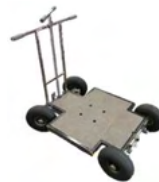
マタドールドリー