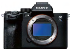
α 7S III