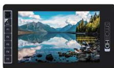
703 Ultra Bright