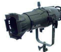
SourceFour - 426