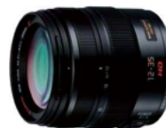
LUMIX G X VARIO 12-35mm / F2.8 II ASPH. POWER O.I.S.