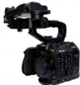
EOS C300 Mark III