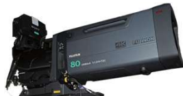
UA80×9 1.2× EXT