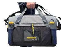
アクセサリバッグ