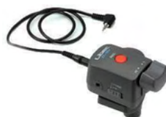
ZC-3DV DV 用ズームリモコン