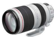
EF100-400mm F4.5-5.6 IS Ⅱ USM