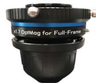
OptMag for Full-Frame