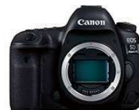
EOS 5D Mark IV