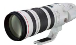
EF200-400mm F4L IS USM EX1.4