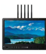
1303 HDR Bolt SK