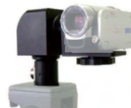
超小型リモコン雲台