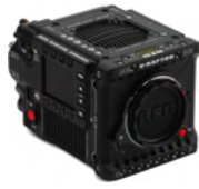
V-Raptor 8K VV/6K S35