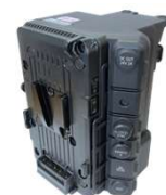
C300 Mark III用拡張ユニット