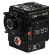
WEAPON MONSTRO 8K VV