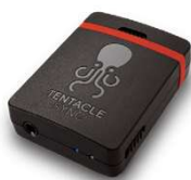
Tentacle Sync E