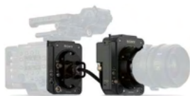
VENICE エクステンションシステム