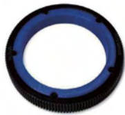
シームレスフォーカスギア for SEL