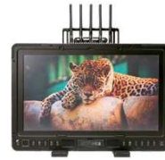
1703 P3X Bolt Sidekick