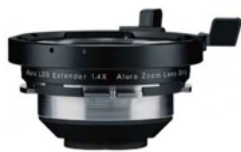
Alura 用エクステンダー ×1.4