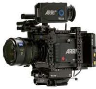
ALEXA MINI LF