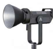
LS 300X(Bi-color LED)