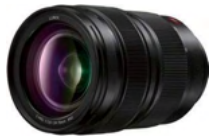
LUMIX S PRO 24-70mm F2.8