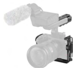
FX3用ハンドルケージ