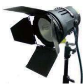
HMI-575 UNI FOCUS