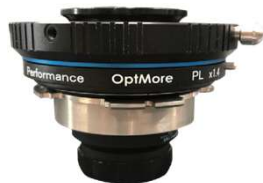
オプトモアエクステンダー ×1.4