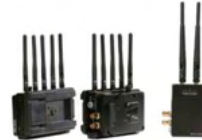
BOLT 3000 XT