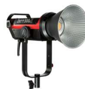
LS C300d II