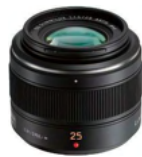
LEICA DG SUMMILUX 25mm / F1.4 II ASPH.