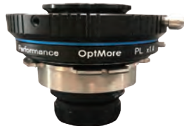
オプトモアエクステンダー x1.4