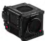
V-Raptor 8K VV/6K S35