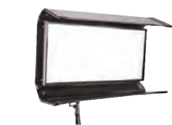
Diva-Lite LED 20DMX