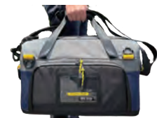
アクセサリバッグ