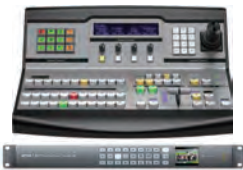
ATEM 1M/E Production 4K