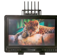
1703 P3X Bolt Sidekick