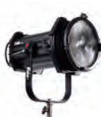
Q8 LED トラベルキット