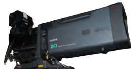
UA80×9 1.2x EXT