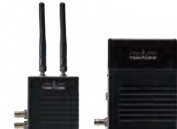
BOLT 500 XT