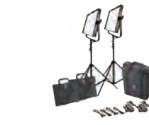
1×1 Bi-Color 2灯セット