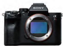
α 7R IV