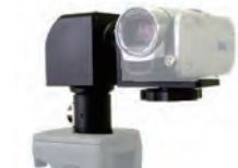
超小型リモコン雲台