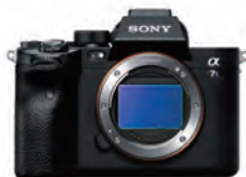
α 7S III