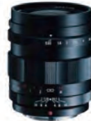
NOKTON 25mm F0.95 Type II