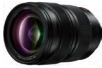
LUMIX S PRO 24-70mm F2.8