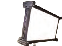
Celeb 200 DMX