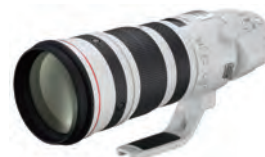
EF200-400mm F4L IS USM EX1.4