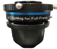
OptMag for Full-Frame