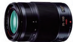
LUMIX G X VARIO 35-100mm / F2.8 II / POWER O.I.S.