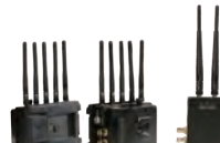
BOLT 3000 XT