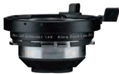
Alura 用エクステンダー x1.4