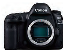
EOS 5D Mark IV