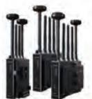
Bolt 4K MAX