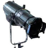
SourceFour LED Lustr +