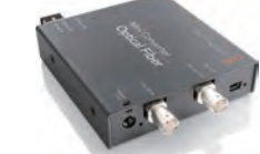
Mini Converter Optical Fiber