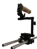
α 7 用リグ