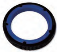
シームレスフォーカスギア for SEL