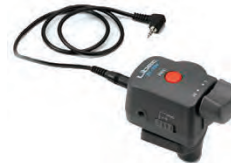
ZC-3DV DV 用ズームリモコン