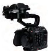
EOS C300 Mark III