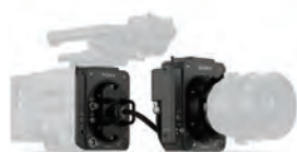
VENICE エクステンションシステム