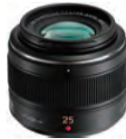
LEICA DG SUMMILUX 25mm / F1.4 II ASPH.