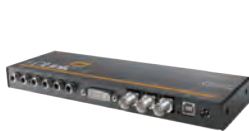
HD Link Pro DVI