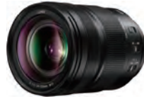
LUMIX S 24-105mm F4 MACRO O.I.S.