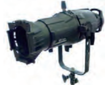
SourceFour - 426