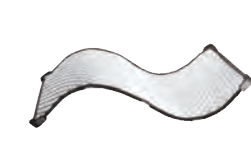
フレキシブルライト FL-1200