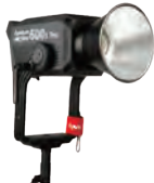
LS 600x Pro(Bi-color LED)