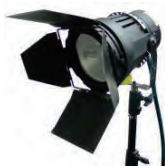
HMI-575 UNI FOCUS