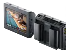
Video Assist 4K