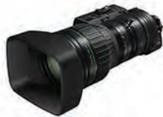
CJ45ex9.7B IASE-V H