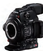
EOS C100 Mark II