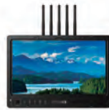
1303 HDR Bolt SK