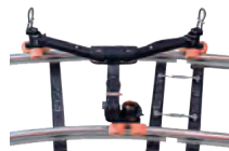
ユニバーサル・ローリングスパイダー