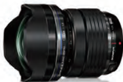
M.ZUIKO DIGITAL ED 7-14mm F2.8 PRO