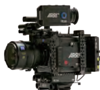
ALEXA MINI LF