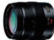
LUMIX G X VARIO 12-35mm / F2.8 II ASPH. POWER O.I.S.