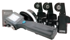
compact set 3