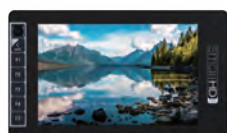
703 Ultra Bright