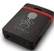
Tentacle Sync E