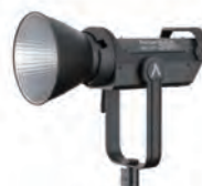
LS 300X(Bi-color LED)