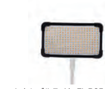
フレキシブルライト FL-B25