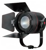
P360 Pro Plus