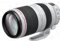
EF100-400mm F4.5-5.6 IS II USM