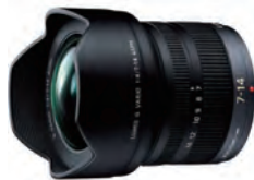
LUMIX G VARIO 7-14mm / F4.0 ASPH.