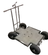
マタドールドリー