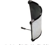
フレキシブルライト FL-600