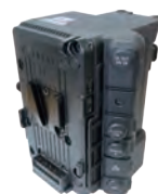
C300 Mark III 用拡張ユニット