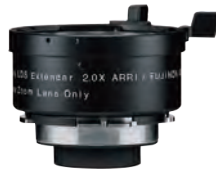
Alura 用エクステンダー x2.0