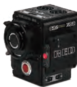
WEAPON MONSTRO 8K VV