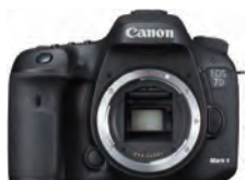
EOS 7D Mark II