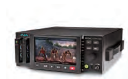
Ki Pro Ultra 12G