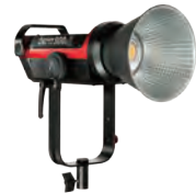
LS C300d II