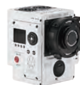
WEAPON HELIUM 8K